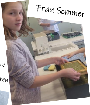
bedrohte Tiere retten