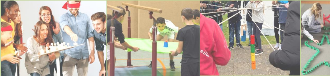
Beispiele, wie Spiele oder Übungen aussehen könnten.

Ihr möchtet eure Persönlichkeit stärken, selbstbewusster werden und „Cool im Team“ sein?